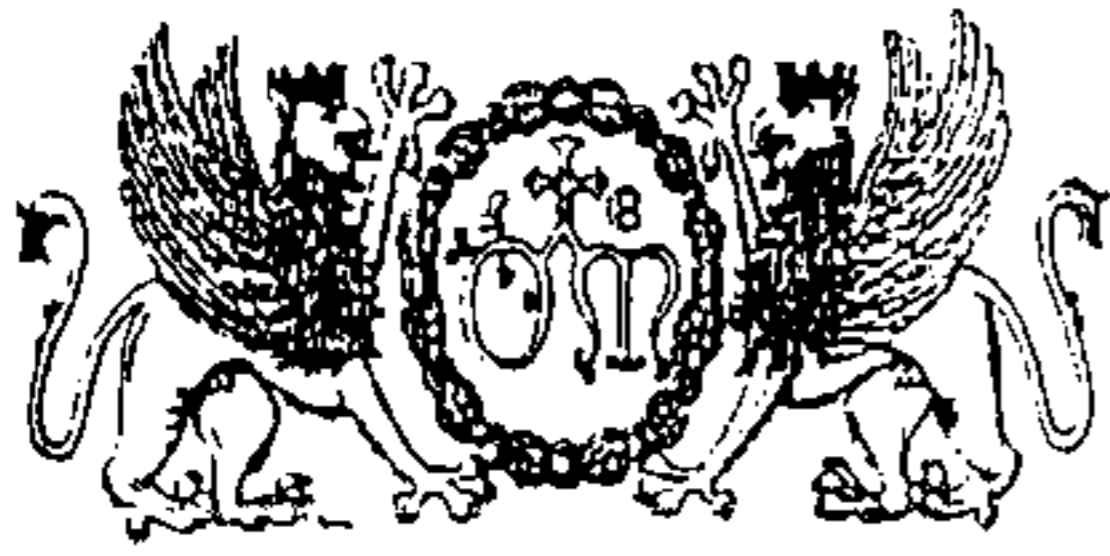
Stemmi dell'Ospedale di S. Maria della Misericordia di Perugia