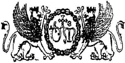
Stemmi dell'Ospedale di S. Maria della Misericordia di Perugia