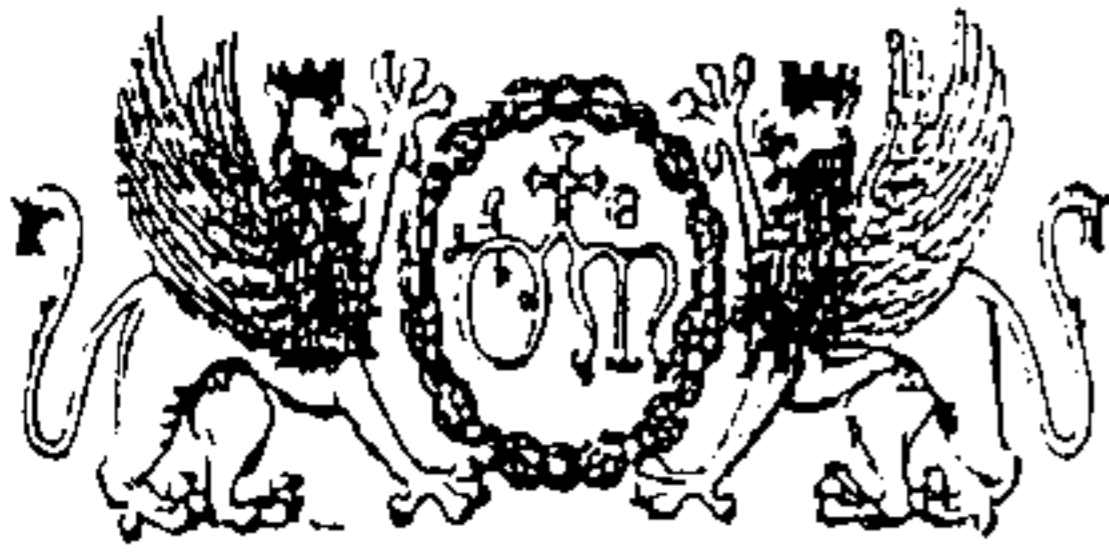
Stemma dell'Ospedale di S. Maria della Misericordia di Perugia