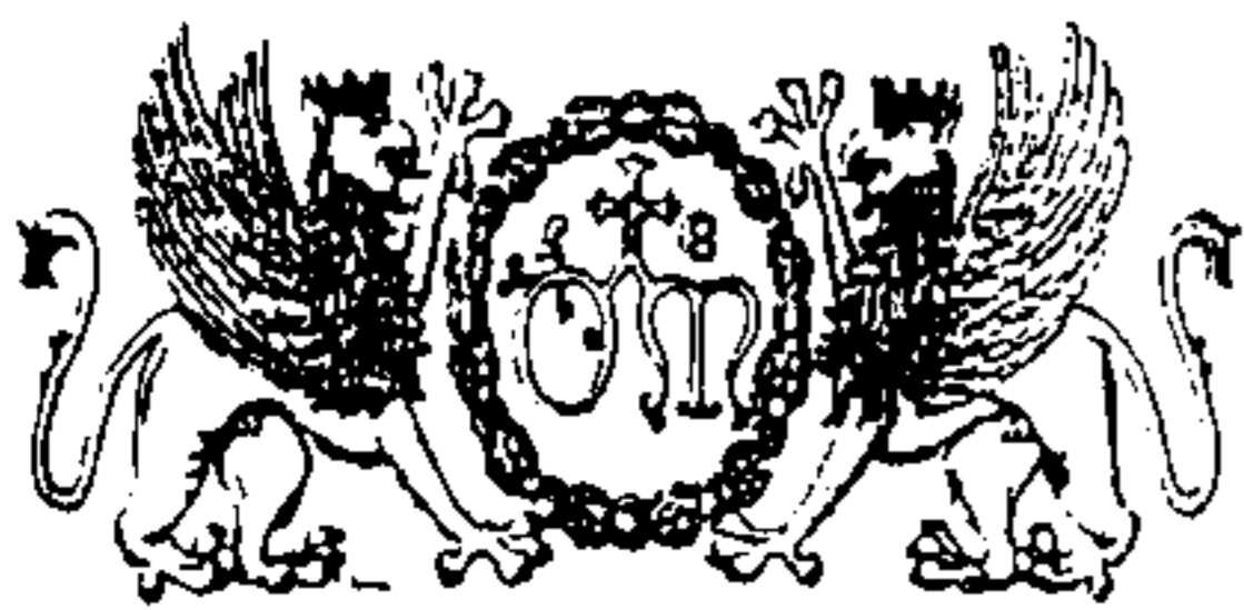
Stemmi dell'Ospedale di S. Maria della Misericordia di Perugia