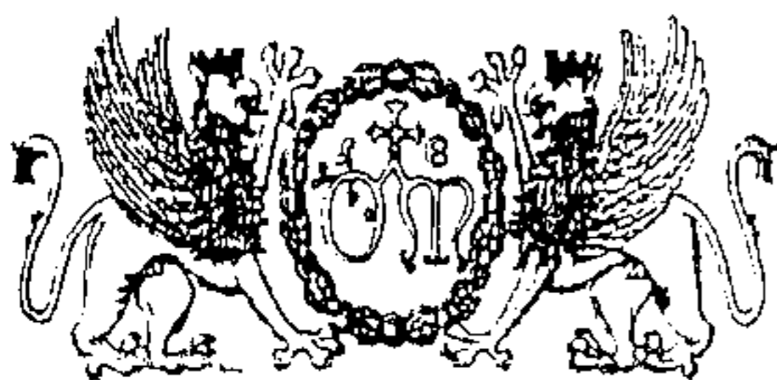
Stemmi dell'Ospedale di S. Maria della Misericordia di Perugia