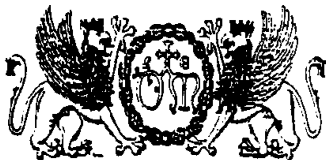
Stemmi dell'Ospedale di S. Maria della Misericordia di Perugia