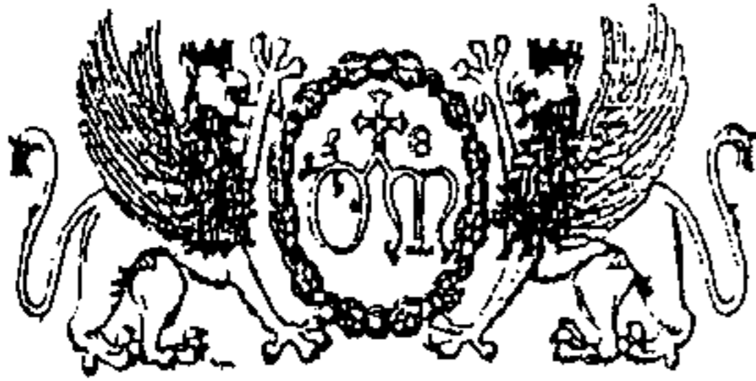
Stemmi dell'Ospedale di S. Maria della Misericordia di Perugia