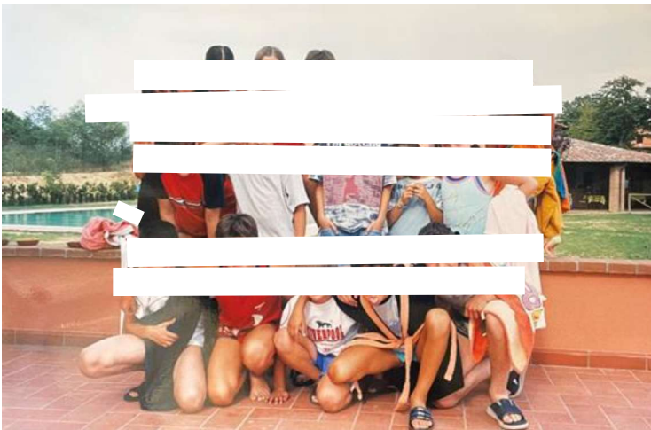
Campo Scuola Bambini - Città della Pieve (2008)

All'interno dell'attività quotidiana sono previsti momenti di supporto psicologico, di formazione e di educazione al diabete gestiti da esperti per migliorare l'accettazione della malattia stessa e adeguarsi ai corretti stili di vita (alimentazione corretta, attività fisica quotidiana regolare).