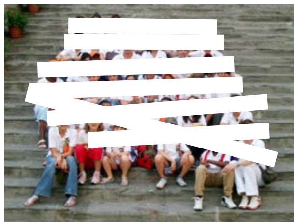
Campo Scuola Bambini - Cortona (2006)

L'Associazione per l'Aiuto ai Giovani con Diabete dell'Umbria ODV, di seguito solo AGD Umbria oppure Associazione, attraverso il lavoro dei suoi volontari FORMATI con corsi mirati (un esempio in tal senso è la formazione al contatto con le famiglie all'esordio in ospedale: "Un Lino per ogni bambino"), ha svolto 30 anni fa il primo Campo di Educazione Sanitaria, ripetendoli ogni anno , sia per bambini ed adolescenti, che per genitori. I campi sono sempre stati svolti in sinergia con il Servizio di Diabetologia Pediatrica Regionale, alcuni di questi arricchiti da esperienze internazionali come quello svolto da AGD Umbria a Cortona con il patrocinio di IDF- Internationale Diabetes Federation a cui parteciparono bambini con diabete provenienti dal Camerun, altri in collaborazione con AGD Italia, come Diabete Sport Training che vide in varie tappe la partecipazione di circa 800 giovani con diabete e 120 professionisti volontari, il più grande campo svolto a livello internazionale dove AGD Umbria oltre che ad essere presente aveva la Presidenza del Coordinamento.