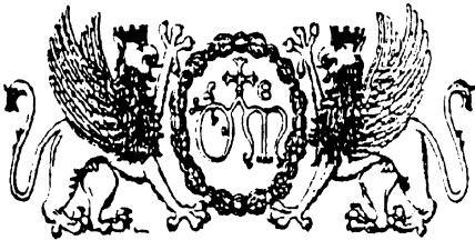
Stemma dell'Ospedale di S. Maria della Misericordia di Perugia