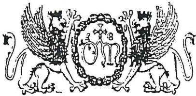
Stemmi dell'Ospedale di S. Maria della Misericordia di Perugia